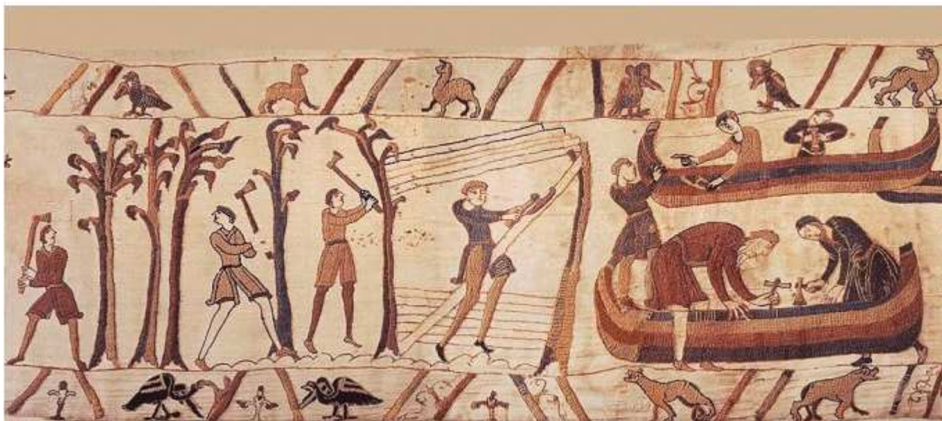
Détail de la Tapisserie de Bayeux

Il semble à cette époque que 60 navires de Guillaume le Conquérant auraient été fournis par le seigneur de Ponty-Audemer; 60 navires au milieu de 1500 pour la conquête de l'Angleterre en 1066.