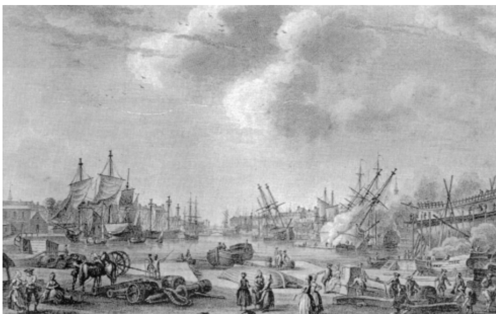
Construction et entretien des navires dans le port du Havre

En 1664, Colbert fit réaliser un inventaire sans précédent des navires présents dans tous les ports. Il créa au Havre l'une des quatre premières écoles de construction navale. Malgré ses efforts, les charpentiers construisirent toujours sans plan jusqu'au début du XVIII e siècle.