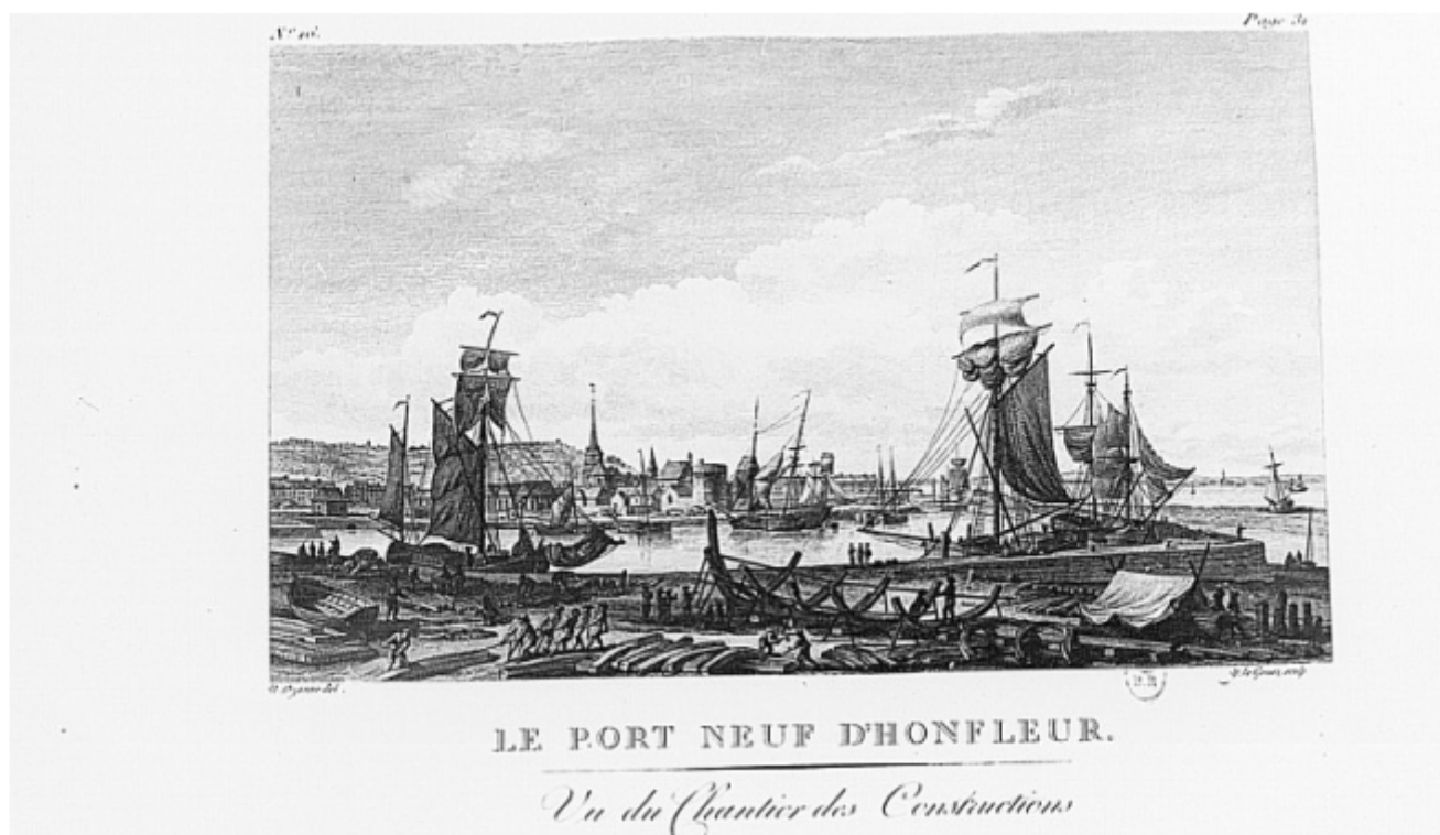
Le port de Honfleur par Nicolas-Marie Ozanne en 1819

L'histoire de Honfleur reste obscure jusqu'à la fin du XV e siècle. Du moins voit-on que les Honfleurais prirent une part active aux opérations navales dès le début des guerres franco-anglaises. Ils armèrent également au cabotage et avaient des chantiers de construction. Quelques uns des grands vaisseaux de guerre de Louis XI (Le Coulon, La Louise, de 790 tonneaux) en sont sortis. Les chantiers de construction navale subsisteront tant que durera la marine en bois.