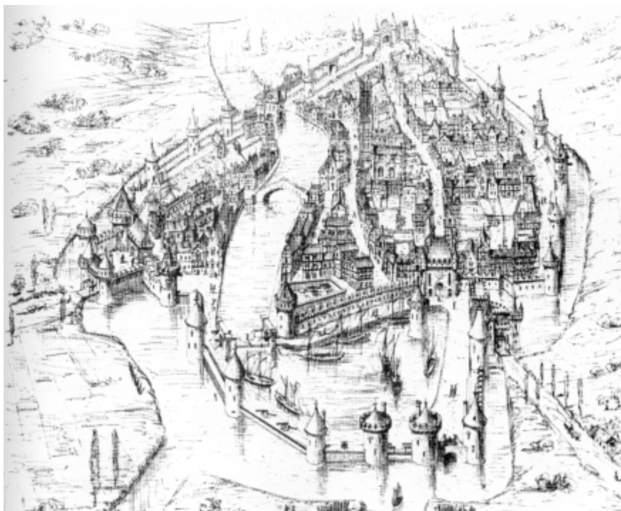
Harfleur, gravure de Guillemard, XV e siècle.

Au Moyen-Age, Harfleur était le plus important port de l'estuaire. Celui-ci recevait des vaisseaux qui venaient s'alléger avant la remontée sur Rouen. Les chantiers de constructions navale furent créés au XII e siècle avant ceux de Rouen et participèrent comme ceux-ci à la création d'une flotte pour un éventuel débarquement en Angleterre.