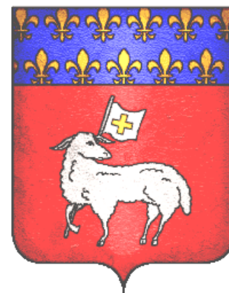
Armoiries de la ville de Rouen